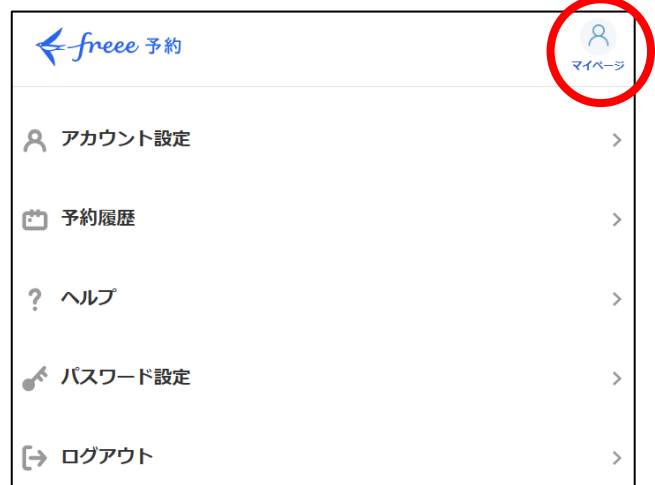
予約サイトのマイページ